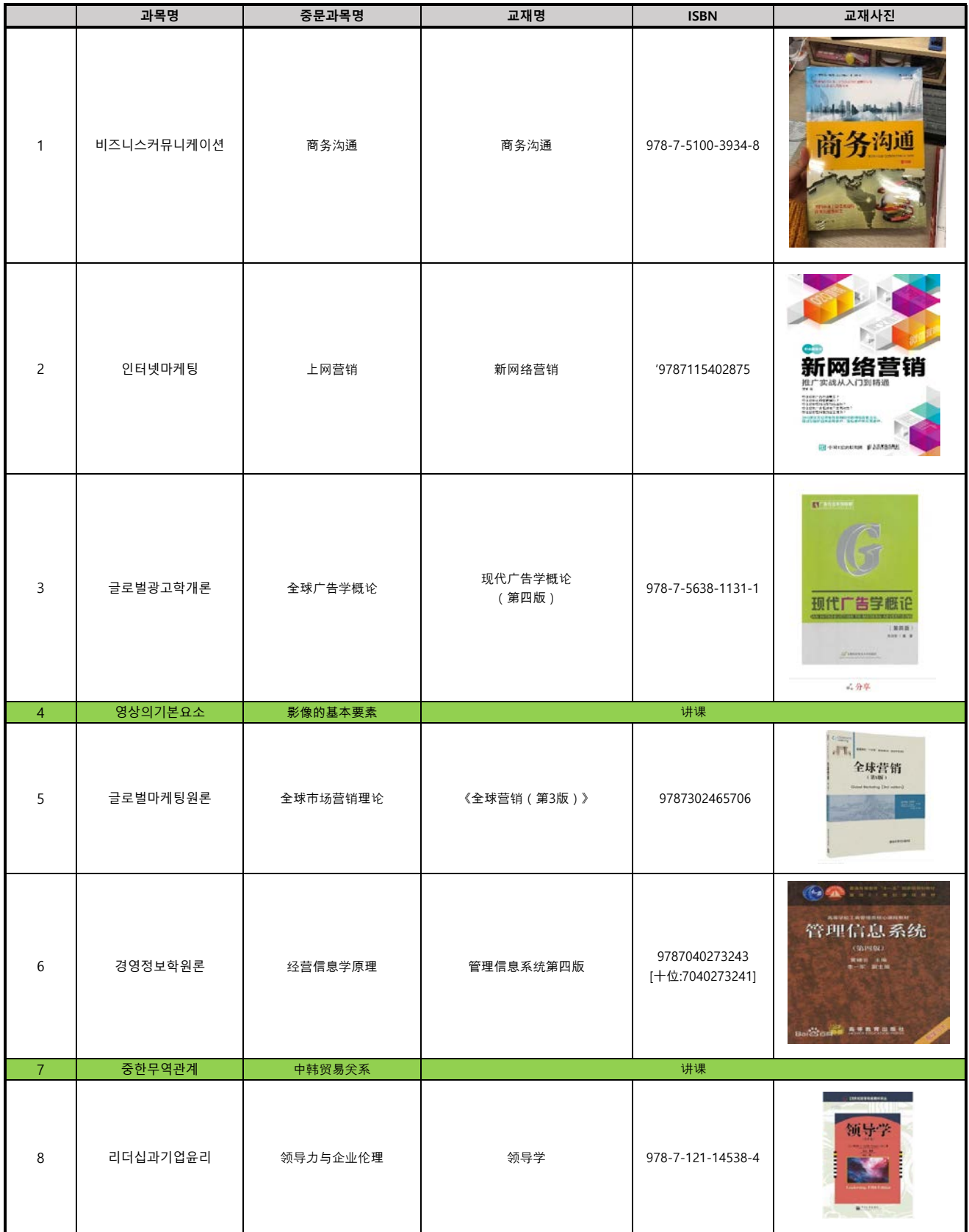
中文MBA 2019-1 教材名称